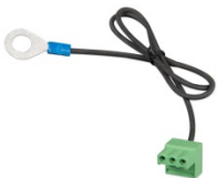
Stecker mit vormontiertem DC-Minus-Kabel (mitgeliefert)