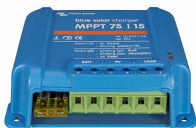
Solar Lade-Regler MPPT 75/15